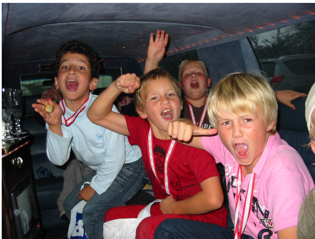
Vinderholdet fra Brændkjærskolen ved SFO games 2007

I sæsonen 2006-2007 fik vi i alt 32 nye medlemmer, og siden sæsonstarten i august 2007 har 28 meldt sig ind.